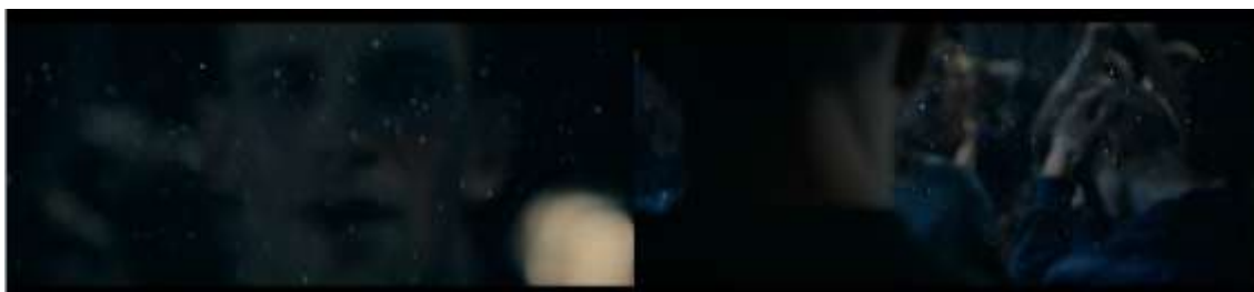
IMAGEM 9: Contaminações subjetivas.

Fonte: Sequência de dois registros de cenas presentes no minuto 115 do filme “120 Batimentos por Minuto” (2017).