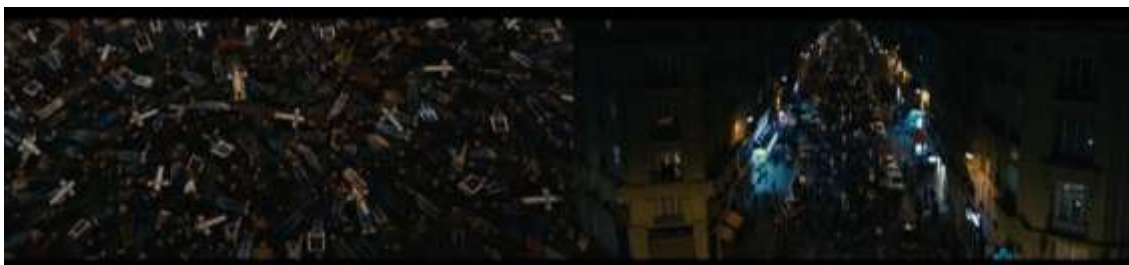
IMAGEM 8: Protestos, lutas e lutos coletivos em tentativas de quebrar silêncios.

Fonte: Sequência de dois registros de cenas presentes no minuto 113 do filme “120 Batimentos por Minuto” (2017).