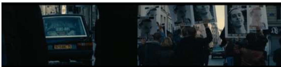
IMAGEM 5: Lutas e lutos políticos.

Fonte: Sequência de dois registros de cenas presentes nos minutos 73 e 74 do filme “120 Batimentos por Minuto” (2017).