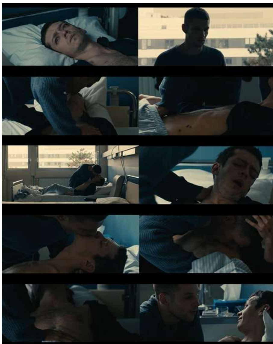
IMAGEM 7: Transa ou desejos em fluxos entre corpos-vivos.

Fonte: Sequência de dez registros de cenas presentes nos minutos 109 e 110 do filme “120 Batimentos por Minuto” (2017).