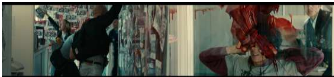
IMAGEM 1: Protestos: invasão-ocupação laboratorial.