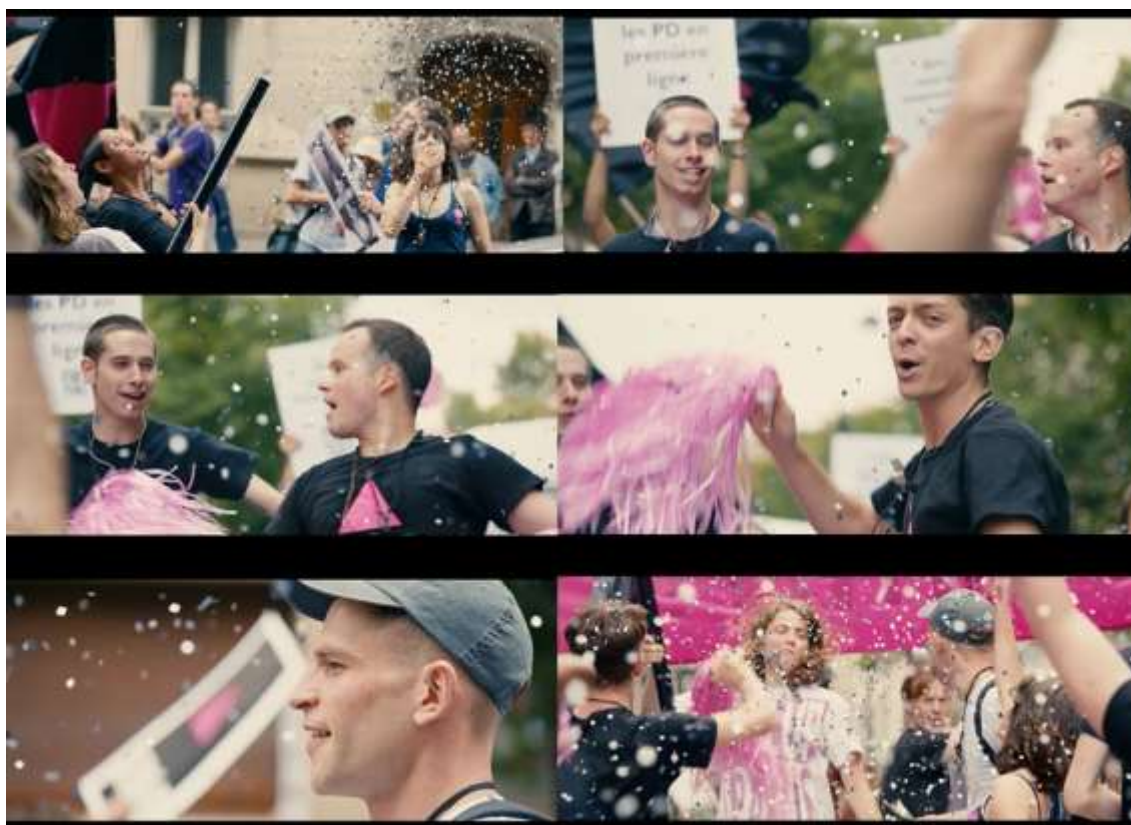
IMAGEM 4: Celebração-viral ou contaminações de vida.

Fonte: Sequência de seis registros de cenas presentes nos minutos 56 e 57 do filme “120 Batimentos por Minuto” (2017).