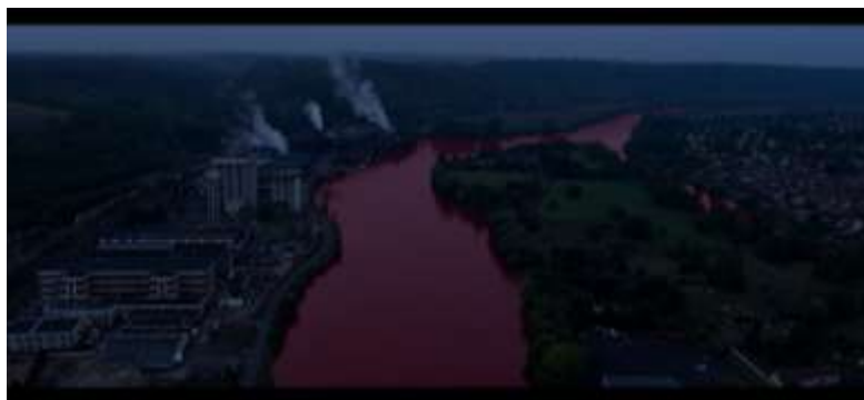
IMAGEM 10: Rio-vaso-sanguíneo em contaminações.