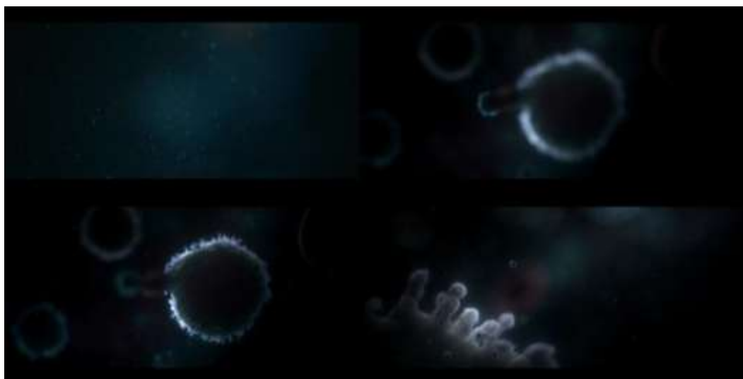
IMAGEM 2: Partículas-vírus ou paisagens-virais.

Fonte: Sequência de quatro registros de cenas dos minutos 25 e 26 do filme “120 Batimentos por Minuto” (2017).