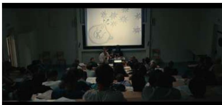
IMAGEM 3: Saberes e práticas em resistências.